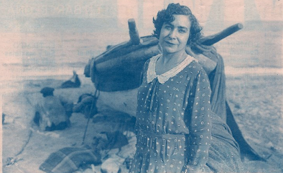
Imagen de Margarita Xirgu en una fotografía tomada en una playa de la costa catalana antes de la guerra